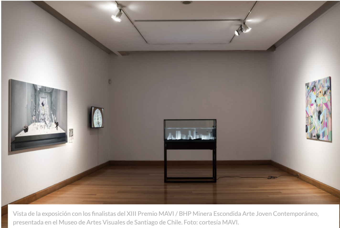
Vista de la exposición con los finalistas del XIII Premio MAVI / BHP Minera Escondida Arte Joven Contemporáneo, presentada en el Museo de Artes Visuales de Santiago de Chile.