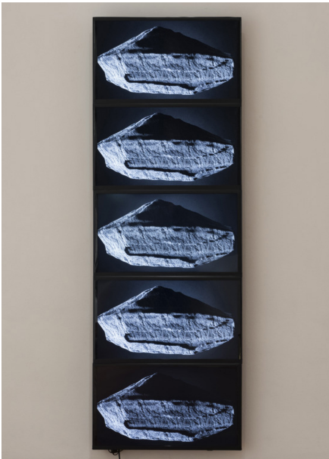
"La Casa de Alúclito" de Samuel Domínguez, obra ganadora del tercer lugar en el XIII Premio MAVI / BHP Minera Escondida Arte Joven Contemporáneo, cuya muestra se presenta en el Museo de Artes Visuales de Santiago de Chile.