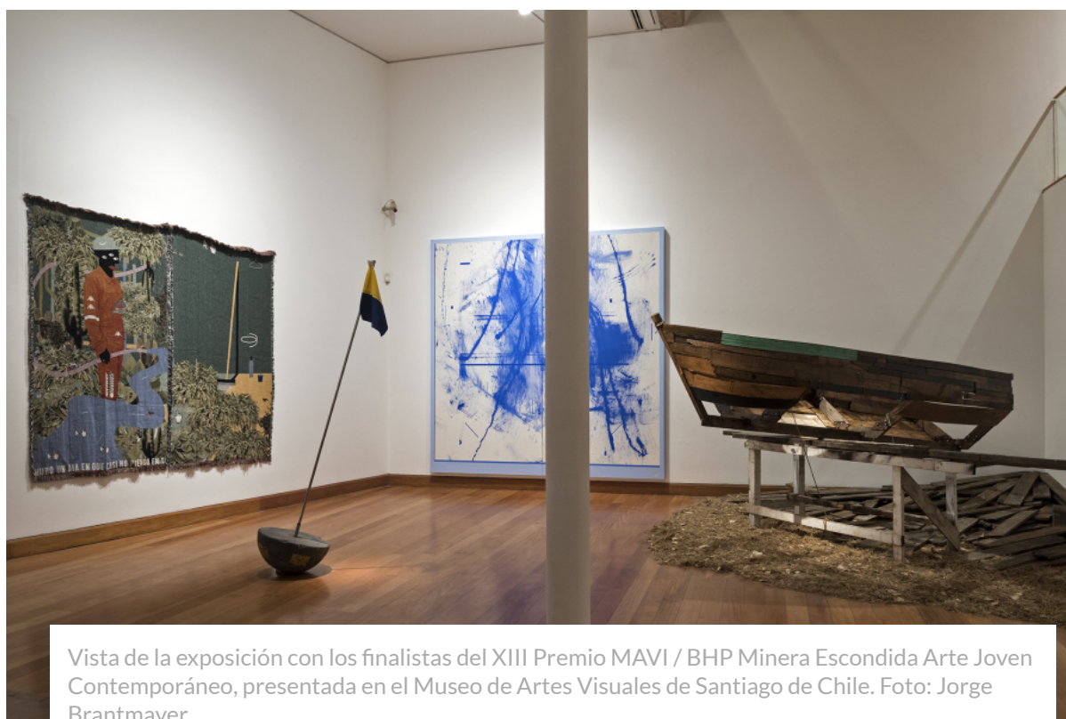
Vista de la exposición con los finalistas del XIII Premio MAVI / BHP Minera Escondida Arte Joven Contemporáneo, presentada en el Museo de Artes Visuales de Santiago de Chile.