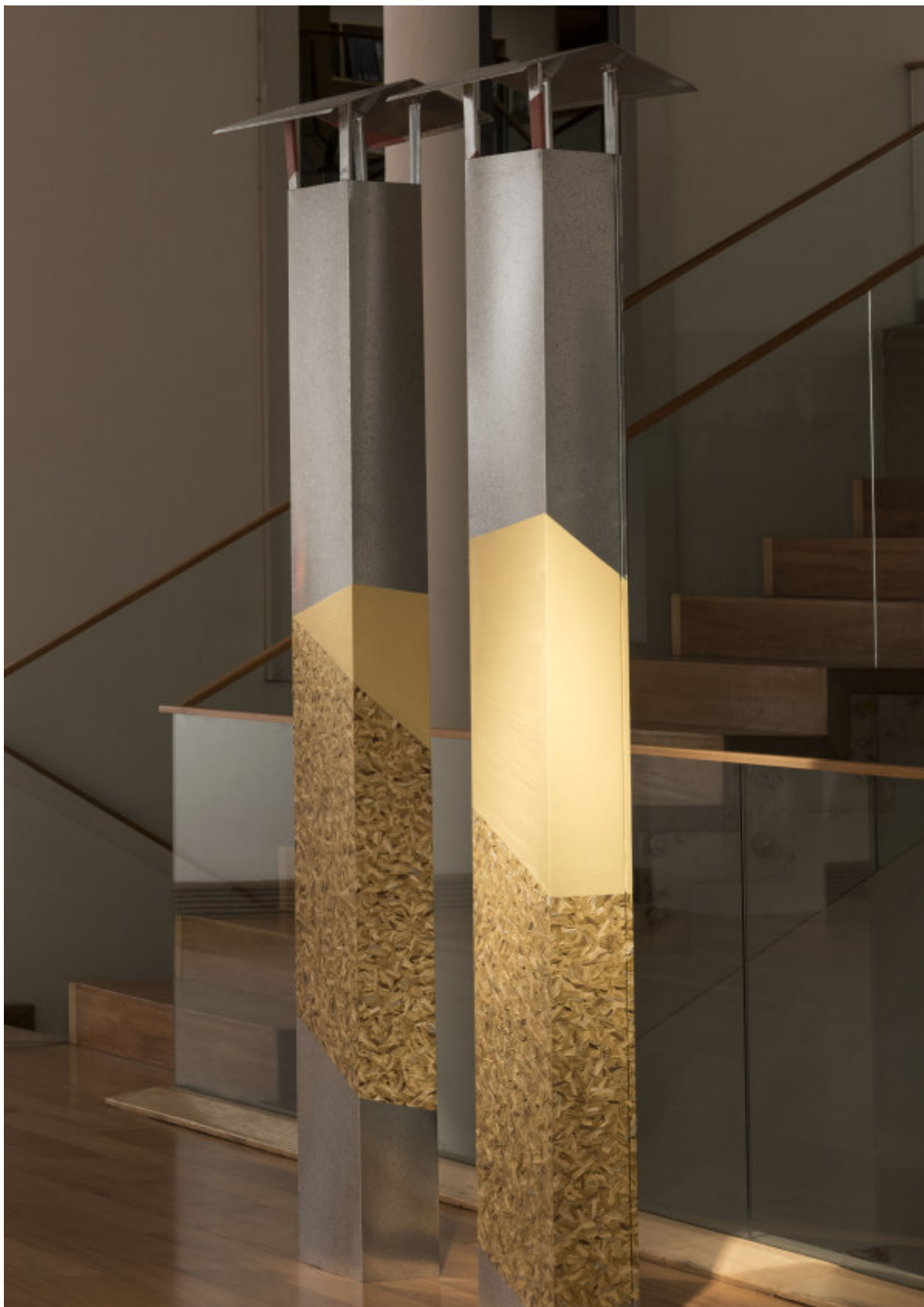
"Señal de progreso" de Laura Galaz, obra ganadora del primer lugar en el XIII Premio MAVI / BHP Minera Escondida Arte Joven Contemporáneo, cuya muestra se presenta en el Museo de Artes Visuales de Santiago de Chile.